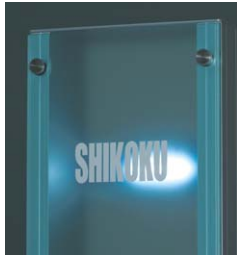
照明 (ポリカタイプ) 長寿命のうえ消費電力が少なく経済的なLEDライトを使用。