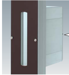
内蔵ポスト 門柱とポストを一体化し、よりシンプルなシルエットに。設置にも場所を取りません。