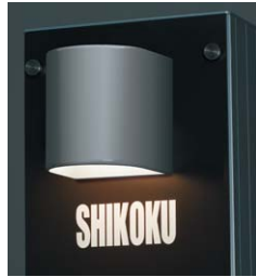
照明 (アルミタイプ/デザインタイプ) 長寿命のうえ消費電力が少なく経済的なLEDライトを使用。