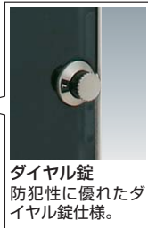
ダイヤル錠 防犯性に優れたダイヤル錠仕様。