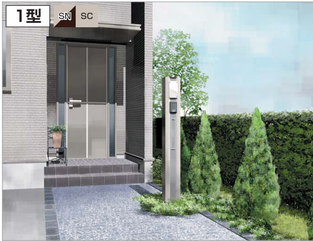
1型価格表 ポストは門柱に内蔵されています。