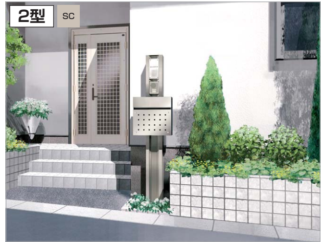
2型価格表 門柱・ポストのセット品です。