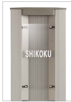
表札CD型 透明アクリル板のおしゃれな表札 です。(05NP-CDN-WH)