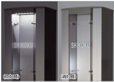
Lタイプ(内蔵照明) 門柱と一体感のある照明。