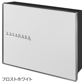
フロストホワイト NA1-PTP06FW ※オプションネームプレート使用