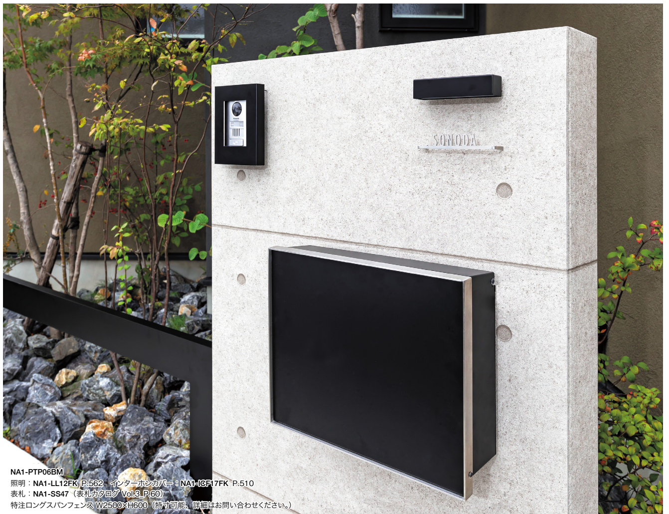
NA1-PTP06BM 照明: NA1-LL12FK P.562 インターホンカバー: NA1-ICF17FK P.510 表札: NA1-SS47 (表札カタログ Vol.13LP.60) 特注ロングスパンフェンス W2500×H600 (特付可能、詳細はお問い合わせください。)

△ 工場出荷時取付・取付位置は変更不可。 ・書体変更、サイズ変更はできません。 ・ネームプレート単体での販売はできません。