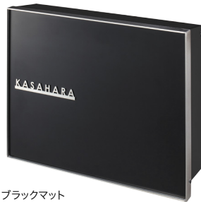
ブラックマット NA1-PTP06BM ※オプションネームプレート使用