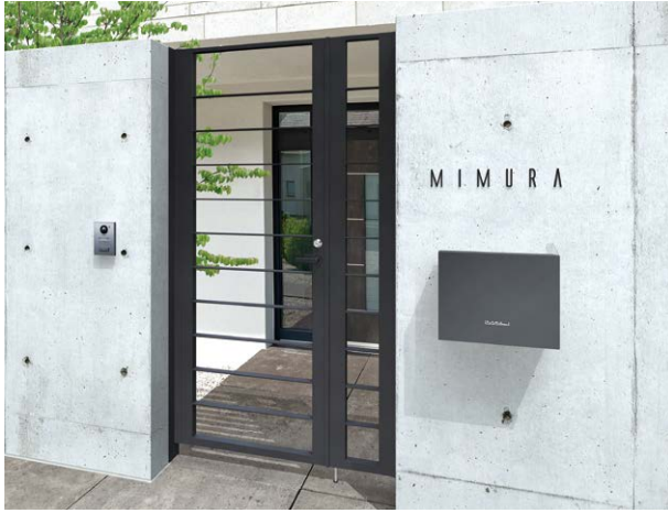
NA1-S93BM × 1 ・ NA1-S93OPBM × 3 ライン門扉 (P.258)