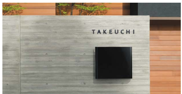
NA1-S94BM × 1 ・ NA1-S94OPBM × 5

⚠ 錆防止の塗装には万全を期しておりますが鉄を主な素材にしておりますので、錆等が発生する場合があります。