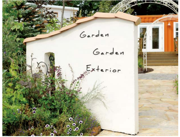
NA1-S92BM × 1 ・ NA1-S92OPBM × 17