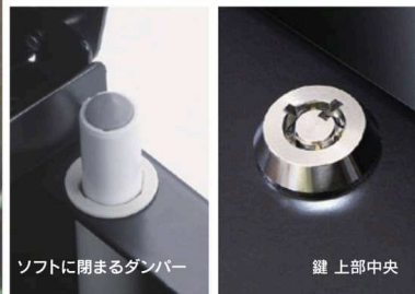
ソフトに閉まるダンパー