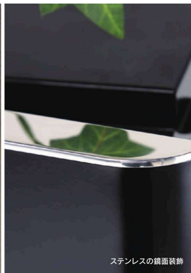
ステンレスの鏡面装飾