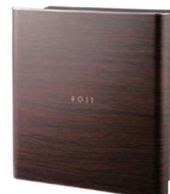
PGR-D (木目調・ダークチェリー)