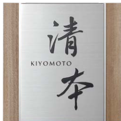
レイアウト 1 IP1-35-1CL 和文：8. 筆文字 欧文：G.Optimum