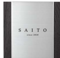
レイアウト 2 IP1-35-20M 欧文：L.Times New Roman