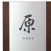
レイアウト 3 IP1-35-3MS 和文：8. 筆文字 欧文：G.Optimum