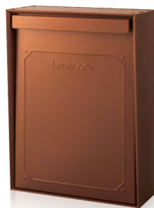
PRO-C(メタリックカッパー)