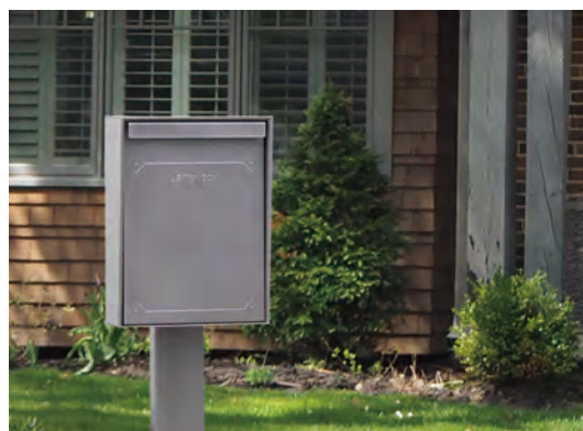
ポストに合わせた専用スタンド