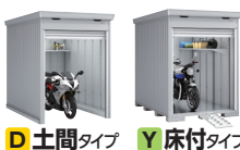
D 土間タイプ Y 床付タイプ