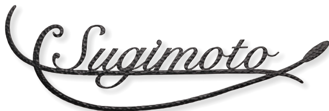
NA1-S41LBB パーンブラック〈BB〉 L 標準サイズ 書体 (E-59) Snell Roundhand Script

L S 標準サイズとスモールサイズからお住まいに合わせてお好みのサイズをお選びください。 ※L・Sサイズは同価格となります。