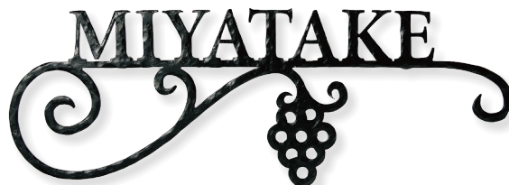
NA1-S46LBB パーンブラック〈BB〉 書体 (E-6) Minion Bold

※品番の△にはサイズ記号が入ります。〈L〉標準サイズ・〈S〉スモールサイズ ※品番末尾の□□には商品色記号が入ります。 〈BB〉パーンブラック・〈BM〉ブラックマット・〈DM〉ダークブラウンマット・〈SA〉シルバーエイジング