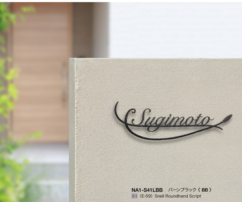
NA1-S41LBB パーンブラック〈BB〉 書体 (E-59) Snell Roundhand Script

書体 281-A 納期 8~14日 取付 材質 変更可能 サイズ 変更不可 RIKCAD 登録商品