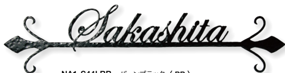
NA1-S44LBB パーンブラック〈BB〉 書体 (E-1) Edwardian Script ITC Regular

■ S41 品番: NA1-S41 △□□ OnlyOne 価格: BB パーンブラック 基本価格 ¥27,000 〈L標準〉 サイズ(mm): W490×H160×D30 重量(kg): 0.5 〈Sスモール〉 サイズ(mm): W300×H100×D30 重量(kg): 0.4