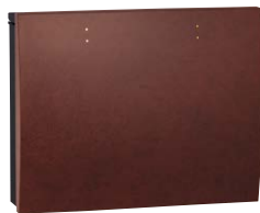
BK レザーアンバー NEW