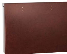
SL レザーアンバー NEW