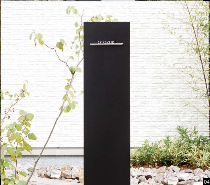
01 個人邸/ブラック 03 シルバー(サイン)マスク 04 ブラック(サイン)ビームイル