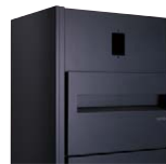
インターホン対応有り