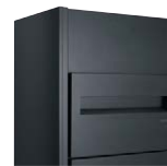
インターホン対応無し (受注後生産)