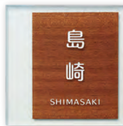
GPA-7 合わせガラス(サベリ)