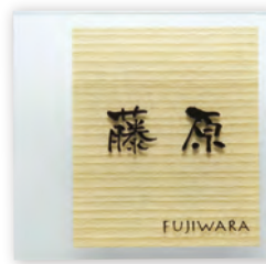
GPA-5 合わせガラス(ホワイトアッシュ)