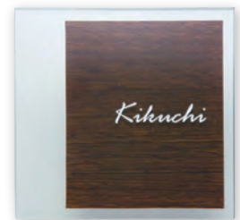
GPA-2 合わせガラス(ウェンジ)