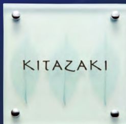
GPA-1 合わせガラス(リーフ)