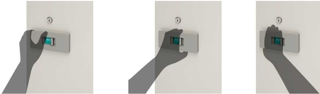
把手の側面に手をかけて開ける