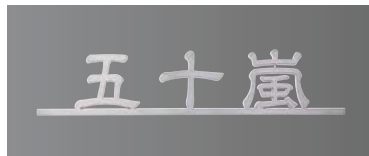
デザインB チタンヘアライン 和文:デザイン隷書