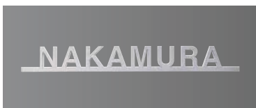
デザインA チタンヘアライン 欧文:ヘルベチカ