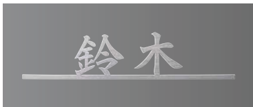
デザインB チタンヘアライン 和文:白舟楷書