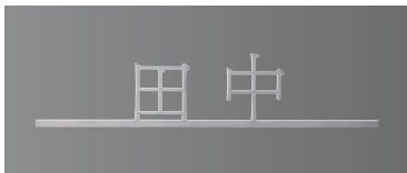
デザインB チタンヘアライン 和文:筑紫アンティーク明朝

商品の色は印刷の性質上、実物と多少違うことがあります。表示価格には消費税・工事費・配送費は含まれていません。