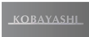
デザインA チタンヘアライン 欧文:オプティマ

※時を超える素材、日本製鉄のデザインチタン「トランティクシー」を使用しています。