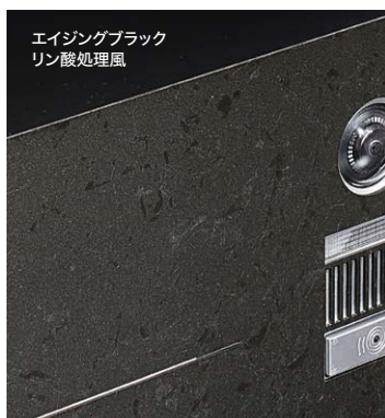
エイジングブラック リン酸処理風