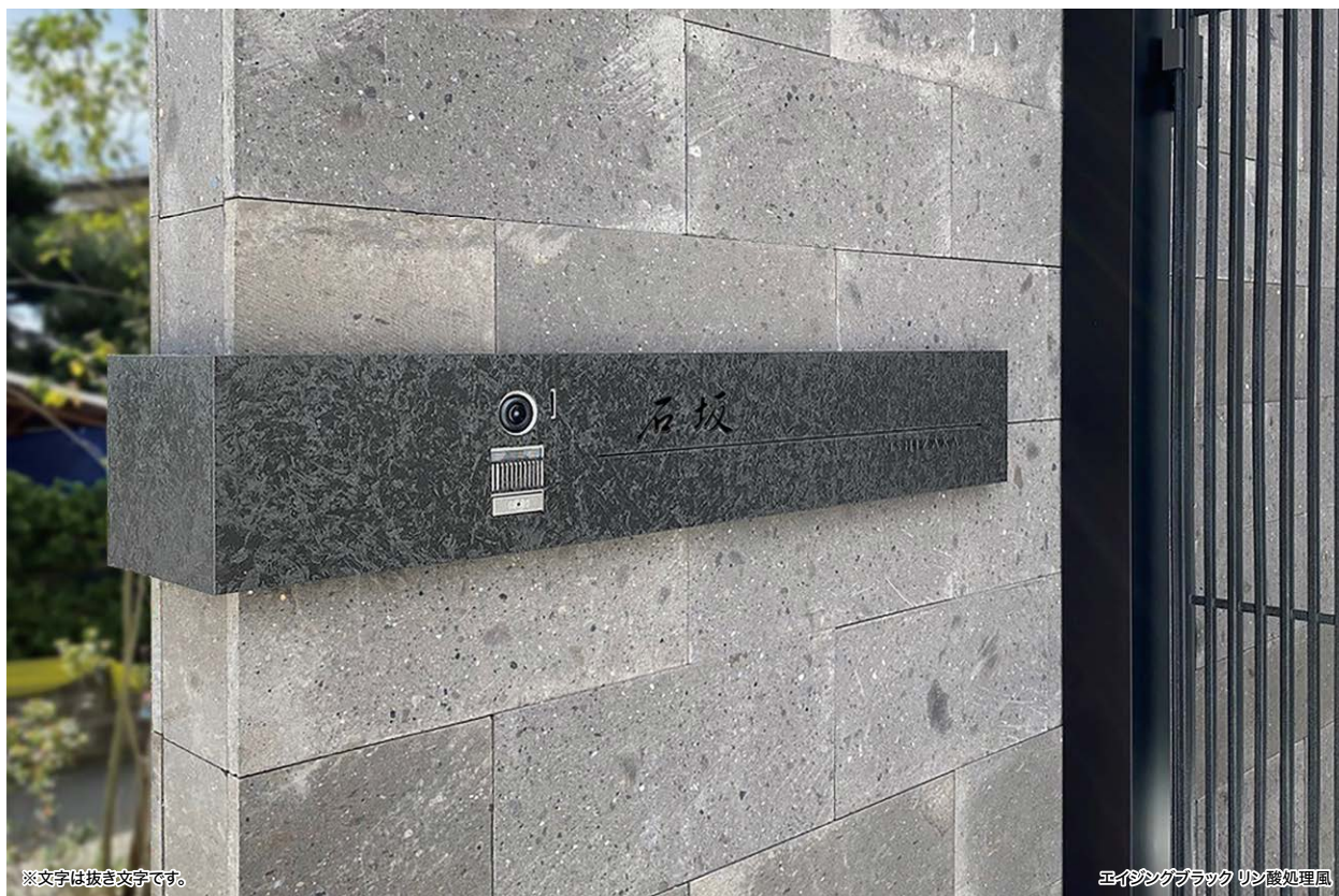
※文字は抜き文字です。