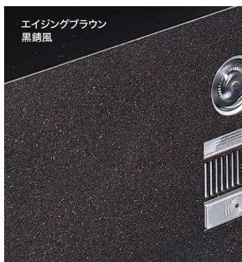
エイジングブラウン 黒錆風