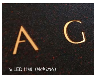
※ LED仕様 (特注対応)