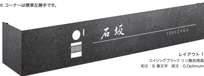
レイアウト 1 エイジングブラック リン酸処理風 和文：8. 筆文字 欧文：G.Optimum