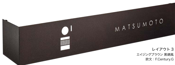
レイアウト 3 エイジングブラウン 黒錆風 欧文：F.Century.G