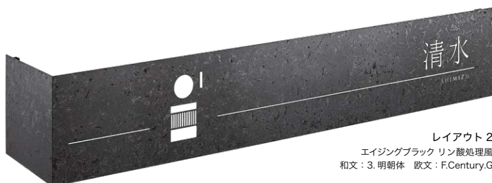
レイアウト 2 エイジングブラック リン酸処理風 和文：3. 明朝体 欧文：F.Century.G