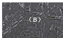
エイジングブラック リン酸処理風