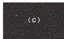
エイジングブラウン 黒錆風