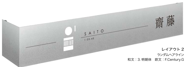
レイアウト 2 ランダムヘアライン 和文：3. 明朝体 欧文：F.Century.G