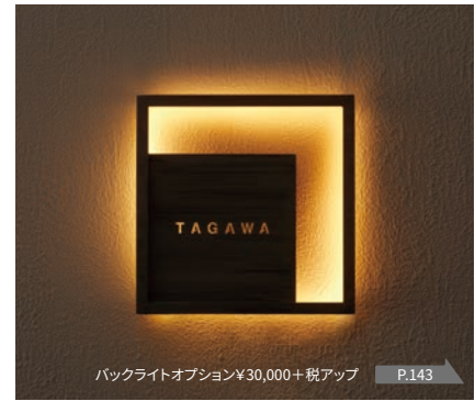
バックライトオプション¥30,000+税アップ P.143